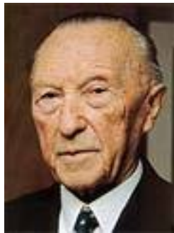
Konrad Adenauer 1876 - 1967

ist das Ergebnis harter und zäher Arbeit. Es erfordert die Anspannung aller Kräfte.