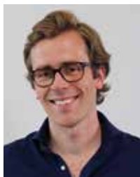
Dr. med. Johannes Wimmer Hauptmoderation

Ärztliche Tätigkeit (Neurologie & Psychiatrie), Lehrkrankenhaus der Charité, Berlin sowie Fernsehmoderator, Präsentator und Autor eigener TV- und Printformate, u.a. Norddeutscher Rund- funk (NDR-Fernsehen), Ullstein Taschenbuch Verlag.