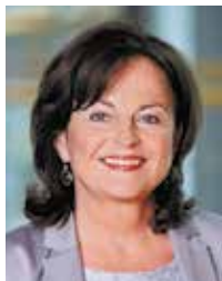
Marlene Mortler, MdB Drogenbeauftragte der Bundesregierung

Drogenbeauftragte der Bundesregierung seit 2014, stellvertretende Vorsitzende der CSU-Landesgruppe im Deutschen Bundestag und Sprecherin der Landesgruppe für Ernährung, Landwirtschaft, Umwelt und Bau