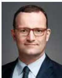
Jens Spahn, MdB Bundesminister für Gesundheit

Jens Spahn ist Bankkaufmann und Politikwissenschaftler (Abschluss Master of Arts). Er ist seit 2002 Mitglied des Deutschen Bundestags. Von 2009 bis 2015 war er gesundheitspolitischer Sprecher der CDU/CSU-Bundestagsfraktion, von Juli 2015 bis März 2018 war er Parlamentarischer Staatssekretär beim Bundesminister der Finanzen. Seit März 2018 ist er Bundesminister für Gesundheit.